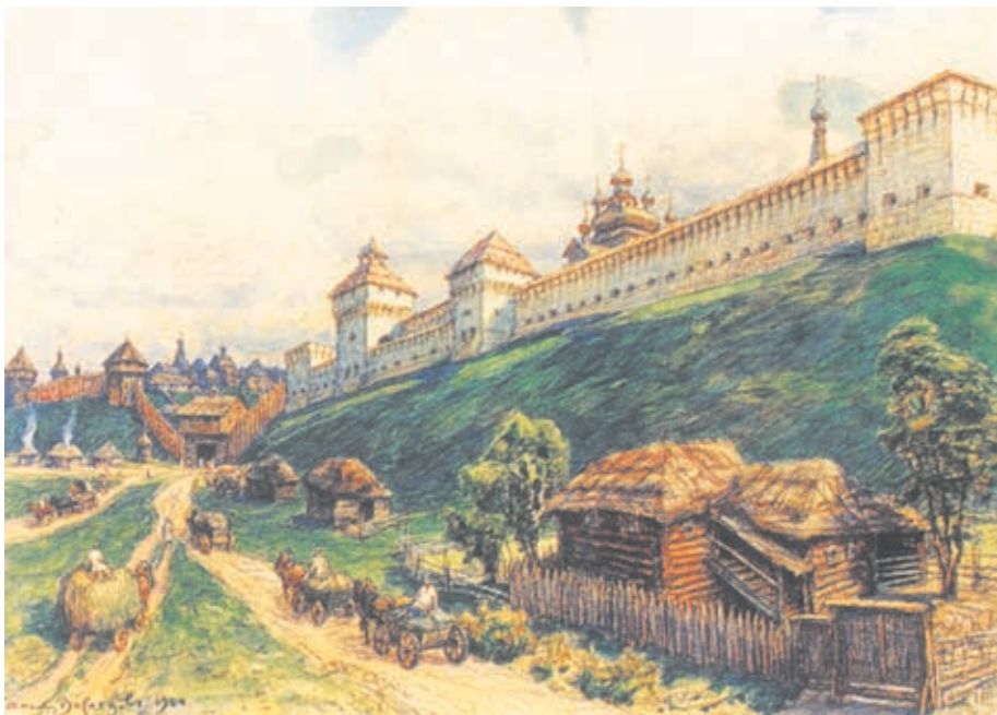
Во времена Московского княжества Серпухов являлся не только стратегической крепостью, но и важным ремесленным и торговым центром. Последнюю функцию он сохранил и на заре истории рода Мазуриных

Как и у большинства купеческих фамилий, начальный этап истории Мазуриных теряется в тумане XVIII столетия. Бесспорно то, что происхождение этой семьи связано с подмосковным городом Серпуховом. В то время это был один из центров деловой и промышленной жизни России. Город славился своими полотняными мануфактурами, востребованными с петровского времени, продавая часть продукции на экспорт. Были в Серпухове кожевенные, шелковые, кирпичные, солодовенные и другие предприятия, а в XIX веке город станет специализироваться на хлопчатобумажном производстве.