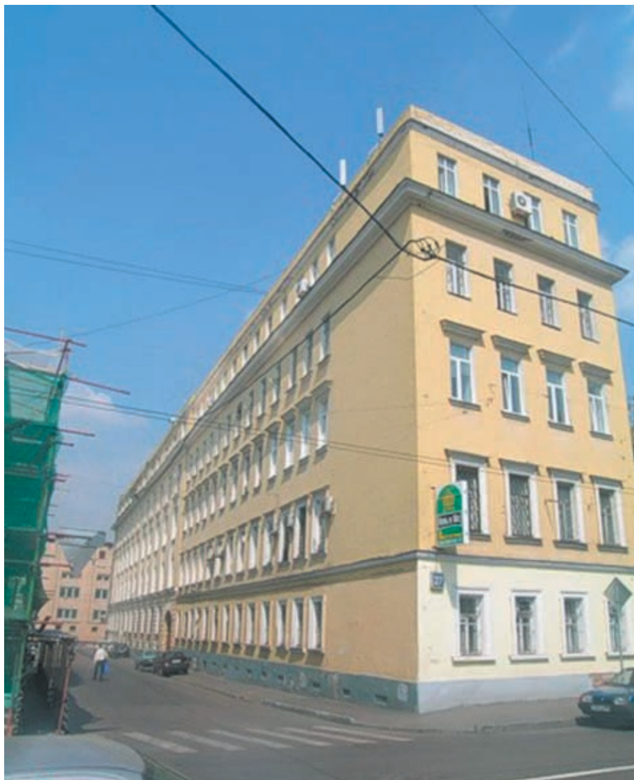
Здание Мазуринского дома бесплатных квартир на Большой Алексеевской (ныне Александра Солженицына) улице в Москве ныне принадлежит ОАО «ГосНИИсинтезбелок»