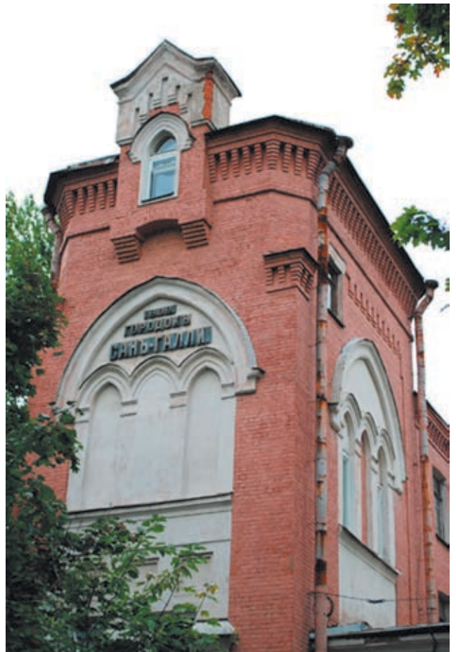
Здание водокачки городка Сан-Галли на Петровском острове неплохо сохранилось до наших дней. Правда, сейчас там расположены жилые квартиры

В 1903 году торжественно отмечали 50-летие фирмы. К тому времени петербургские Сан-Галли представляли собой сплоченный и довольно многочисленный клан – в Россию перебрались братья Франца Карловича, а у него самого выросли сыновья. Старший, Франц Францевич, и возглавил фирму «Сан-Галли и наследники» после смерти ее основателя