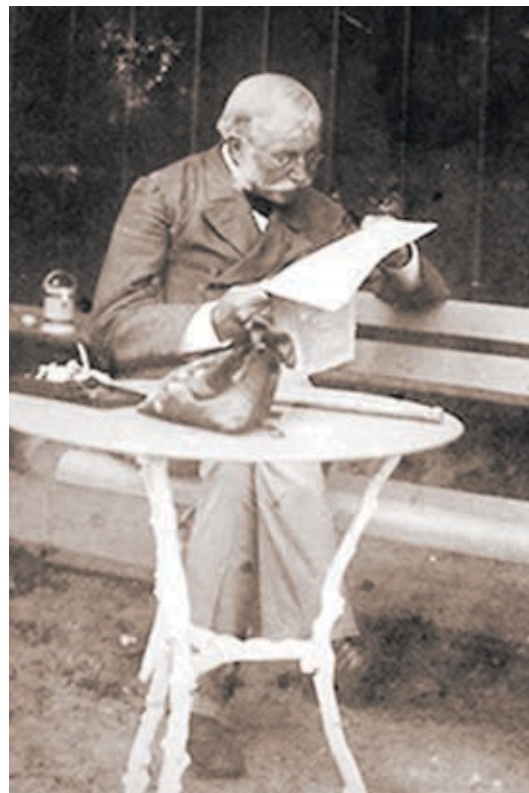
За свои заслуги перед российской промышленностью Франц Карлович Сан-Галли удостоился высоких правительственных наград, в числе которых – орден святого Владимира IV степени, дававший право на личное дворянство, и звезда ордена святого Станислава I степени