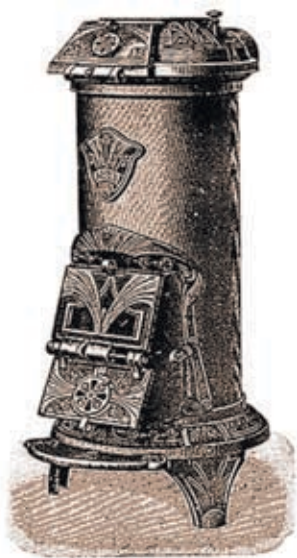
Чугунная печь «ирландской системы» из каталога завода Сан-Галли

Он стремился стать лидером в своем деле, и вот Сан-Галли поставил целью пре-