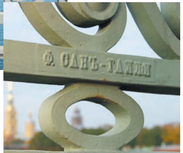
При реконструкции Троицкого моста в 2002 году были бережно восстановлены все упоминания об изготовителе деталей ограды – заводе «Сан-Галли»