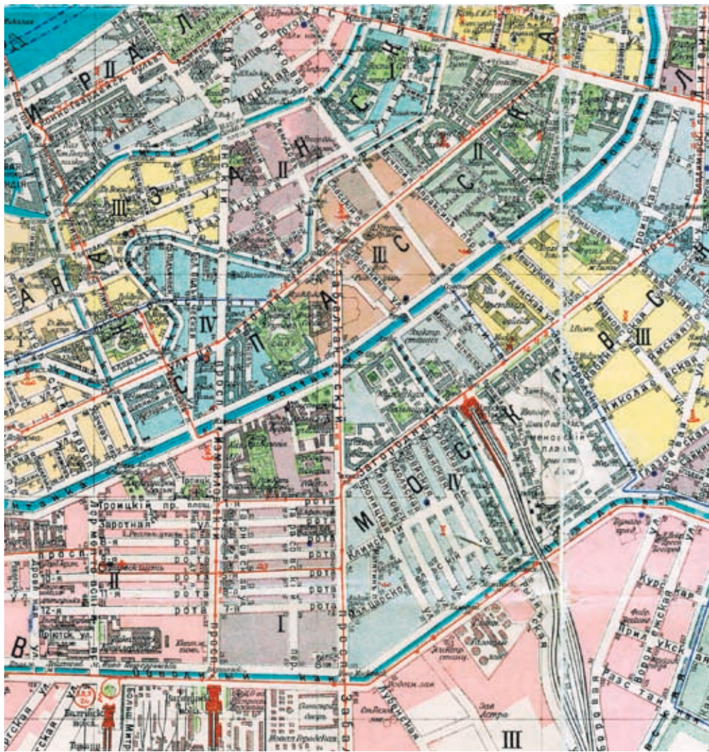
Завод и колония Сан-Галли были главными объектами в квартале между Лиговкой