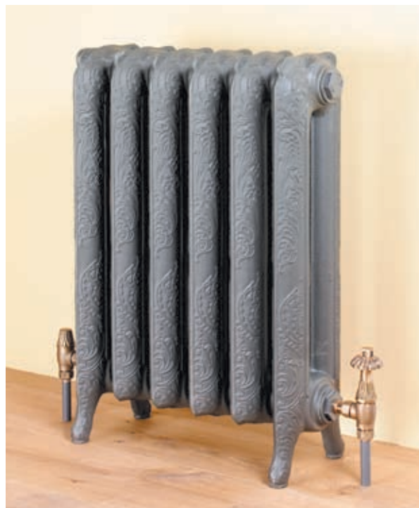
В наши дни многие изделия завода Сан-Галли, в том числе отопительные батареи, продаются в качестве антиквариата

После долгих размышлений и практических опытов он сконструировал «горя-